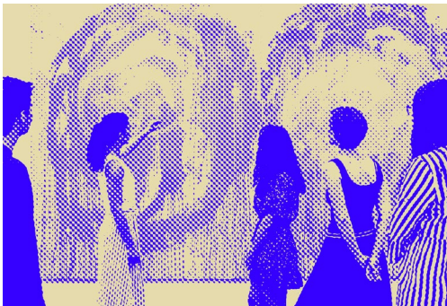
FOKUS AUF KÜNSTLER:INNEN UND KREATIVPROJEKTE MIT BEZUG ZUR SAMMLUNG BRANDHORST