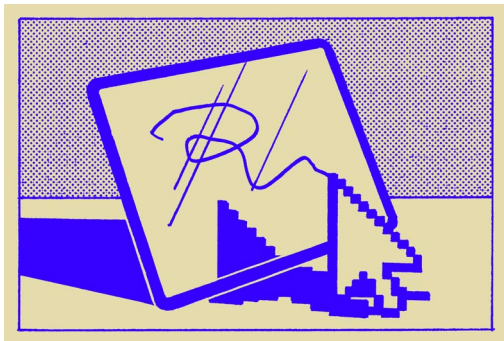
INDIVIDUELLE PLANUNG UND FOKUSWAHL JE NACH ZEITLICHEN RESSOURCEN, LEHRPLANBEZUG UND KLASSENSTUFE