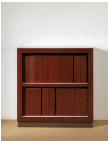
Richard Artschwager Encyclopedia Britannica, 1963