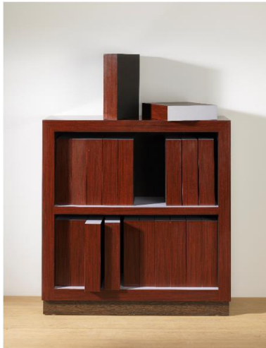
Richard Artschwager Encyclopedia Britannica, 1963