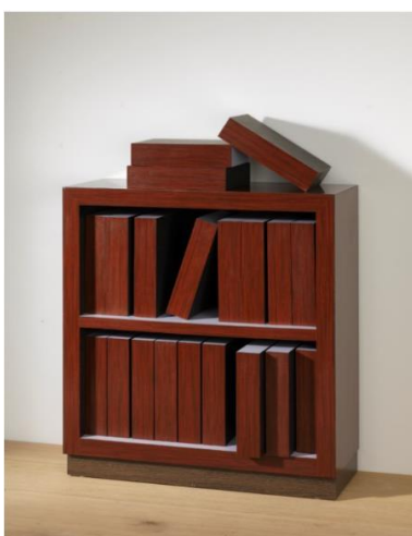
Richard Artschwager Encyclopedia Britannica, 1963