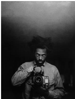
Arthur Jafa Monster, 1988, gedruckt 2019