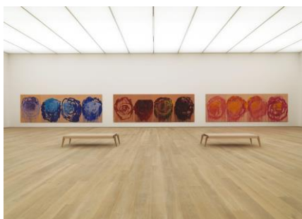
Rosensaal im Museum Brandhorst

© Cy Twombly Foundation Photo: Nicole Wilhelms, Bayerische Staatsgemäldesammlungen, Museum Brandhorst, Munich