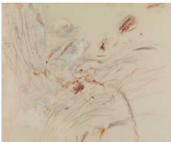
Cy Twombly Untitled (Roma), 1962

Museum Ludwig, Köln.