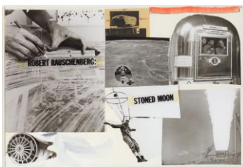
Robert Rauschenberg Cover Page, Stoned Moon Book, 1970

© Cy Twombly Foundation Photo: Haydar Koyupinar, Bayerische Staatsgemäldesammlungen, Museum Brandhorst, Munich