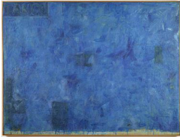
Jasper Johns, Tango, 1955