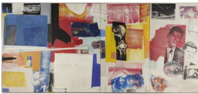
Robert Rauschenberg, Axle, 1964

Museum Ludwig, Photo: Rheinisches Bildarchiv Köln