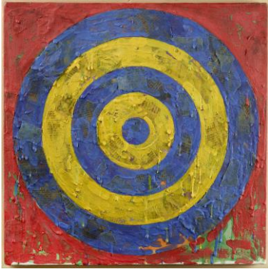
Jasper Johns, Target, 1974

Enkaustik und Zeitungspapier auf Leinwand, 40,6 x 40,6 cm