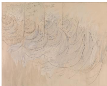
Cy Twombly Orion III (New York), 1968

Dispersion, Kreide und Bleistift auf Leinwand 172,5 x 216 cm