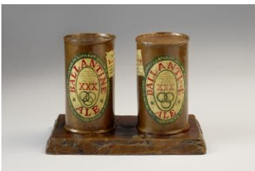
Jasper Johns, Painted Bronze / Ale Cans, 1960

Museum Ludwig, Photo: Rheinisches Bildarchiv Köln