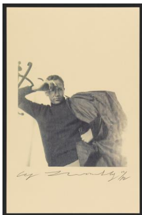
Cy Twombly Robert Rauschenberg (Tetuan, Morocco), 1952

© Cy Twombly Foundation Photo: Haydar Koyupinar, Bayerische Staatsgemäldesammlungen, Museum Brandhorst, Munich