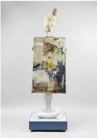
Robert Rauschenberg, Odalisk, 1955-58

Museum Ludwig, Photo: Rheinisches Bildarchiv Köln