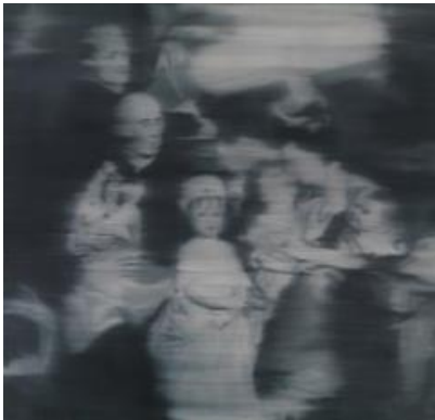
Gerhard Richter (*1932) Familie nach Altem Meister, 1965