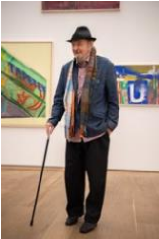
K.H. Hödicke in der Ausstellung „Spot On: German Pop“ im Museum Brandhorst, 2020

© VG Bild-Kunst, Bonn 2020; Museum Brandhorst Photo: Haydar Koyupinar, Bayerische Staatsgemälde- sammlungen, Munich.