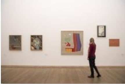
Ausstellungsansicht „German Pop“ mit Werken von Sigmar Polke, K.H. Hödicke, Joseph Beuys und Jörg Immendorff

© The Estate of Sigmar Polke / VG Bild-Kunst, Bonn 2020; The Estate of Jörg Immendorff, Courtesy Galerie Michael Werner Märkisch Wilmersdorf, Köln & New York; Museum Brandhorst