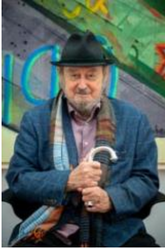
K.H. Hödicke in der Ausstellung „Spot On: German Pop“ im Museum Brandhorst, 2020