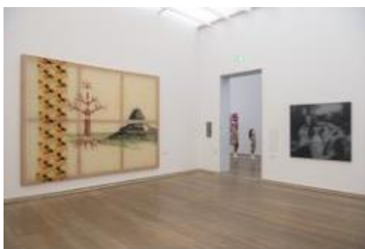
Ausstellungsansicht „German Pop“ mit Werken von Sigmar Polke und Gerhard Richter

© VG Bild-Kunst, Bonn 2020; Museum Brandhorst Photo: Haydar Koyupinar, Bayerische Staatsgemälde- sammlungen, Munich.