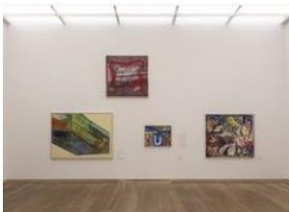
Ausstellungsansicht „German Pop“ mit Werken von K.H. Hödicke

© The Estate of Sigmar Polke / VG Bild-Kunst, Bonn 2020 Photo: Haydar Koyupinar, Museum Brandhorst, Bayerische Staatsgemäldesammlungen, Munich.