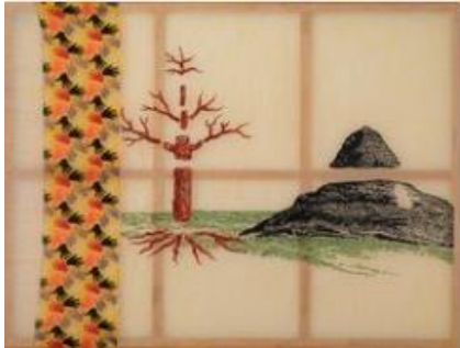
Sigmar Polke (1941-2010) Die drei Lügen der Malerei, 1994

Kunstharz und Lack auf Polyestergewebe 300,8 x 400,2 cm