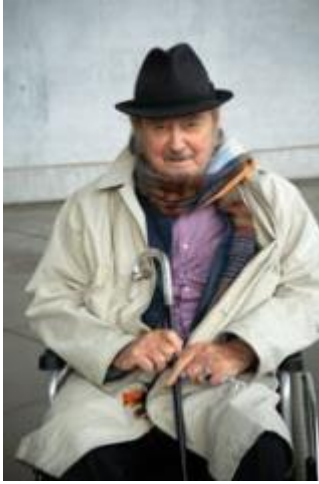
K.H. Hödicke vor der Pinakothek der Moderne, 2020