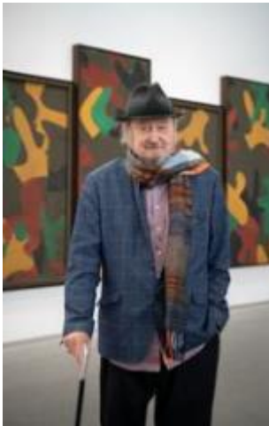
K.H. Hödicke vor dem Werk „Jäger und Gejagter im deutschen Wald“ in der Pinakothek der Moderne, 2020

© VG Bild-Kunst, Bonn 2020; Museum Brandhorst