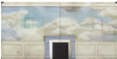
Lucy McKenzie May of Teck, 2010

© Lucy McKenzie. Photo: Mark Blower. Courtesy the artist and Cabinet, London.