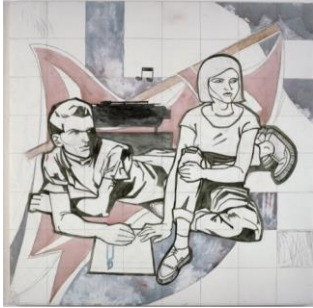
Lucy McKenzie Global Joy II, 2001

Acryl und Grafit auf Leinwand 122 x 122 cm