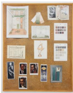
Lucy McKenzie Quodlibet XXI (Objectivism), 2012

© Lucy McKenzie. Photo: Lothar Schnepf. Courtesy of the artist; Galerie Buchholz, Cologne/Berlin/New York; and Cabinet, London.