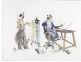
Lucy McKenzie Untitled, 2011

Buntstift und Grafit auf Papier 30 x 40 cm