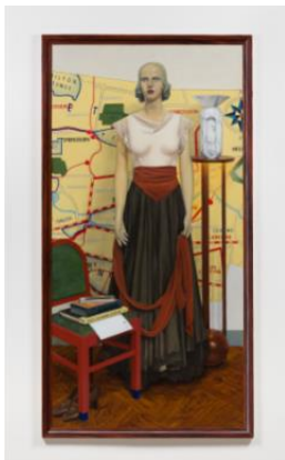
Lucy McKenzie Rebecca, 2019

© Lucy McKenzie. Photo: Kristien Daem. Courtesy the artist and Cabinet, London.