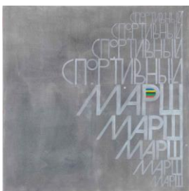
Lucy McKenzie Sport March, 2000

© Lucy McKenzie. Photo: Jens Ziehe. Courtesy of the artist; Galerie Buchholz, Cologne/Berlin/New York; and Cabinet, London.