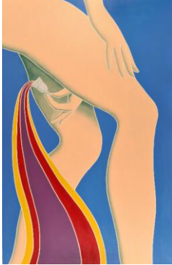
Lucy McKenzie Mooncup, 2012 (Detail)

Acryl auf Leinwand 3 Teile; je 400 × 260 cm