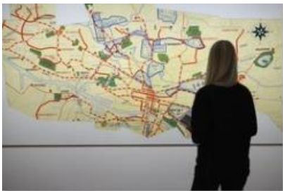
Besucherin vor Lucy McKenzies Werk „Glasgow 1938 1966“ (2017) in der Ausstellung „Lucy McKenzie – Prime Suspect“