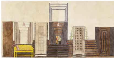
Lucy McKenzie Interior (Detail: C.R. Mackintosh - Design for the Dug-out, Willow tearooms, 1917), 2007

© Lucy McKenzie. Photo: Lothar Schnepf. Courtesy of the artist; Galerie Buchholz, Cologne/Berlin/New York; and Cabinet, London.