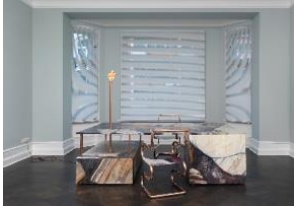
Lucy McKenzie Violet Breche Desk, 2015

Schreibtisch: Öl auf Leinwand auf Faserplatte, Kupfer, Muschel, Glühbirne, Kabel; Stühle: Öl auf Leinwand, Kupfer Schreibtisch: 190 x 240 x 160 cm; Stühle: je 97 x 50 x 50 cm